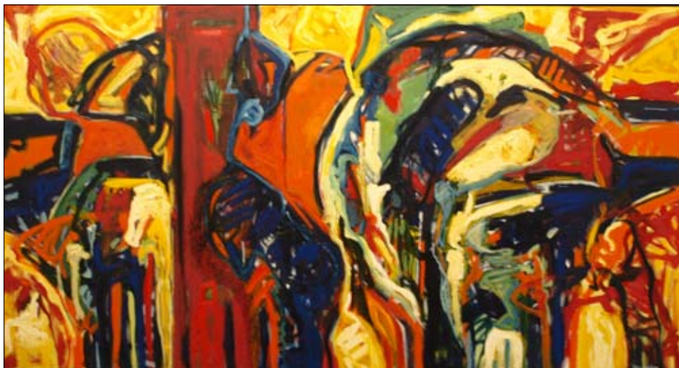
Oliemaleri str. 80 x 150 cm. 2011. "A Closer Look At The World Behind"

til udbrud inde i vore hoveder. I flere af malerierne finder man figurer, ikke mindst fugle. Fuglene er et symbol på friheden, og som sådan skal de ses. En frihed, der frigøres, når "sindet ulmer". De mange års vedholdende beskæftigelse med maleriet har givet ham den sikkerhed, som man i dag kan aflæse af hans billeder.