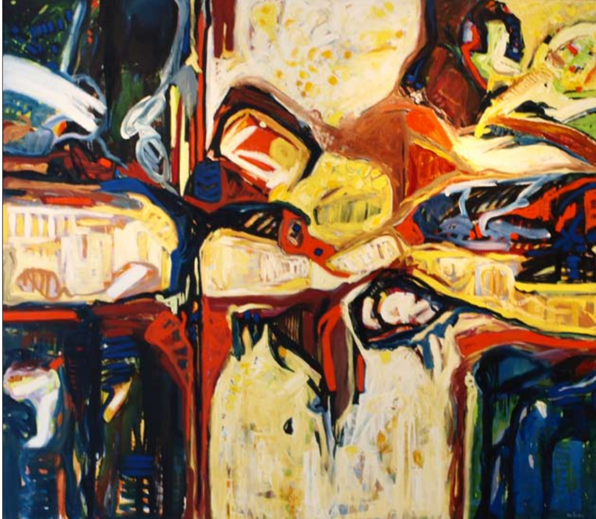
Ollimäkelä str. 165 x 190 cm. 2011. "A Closer Look At The World Behind"