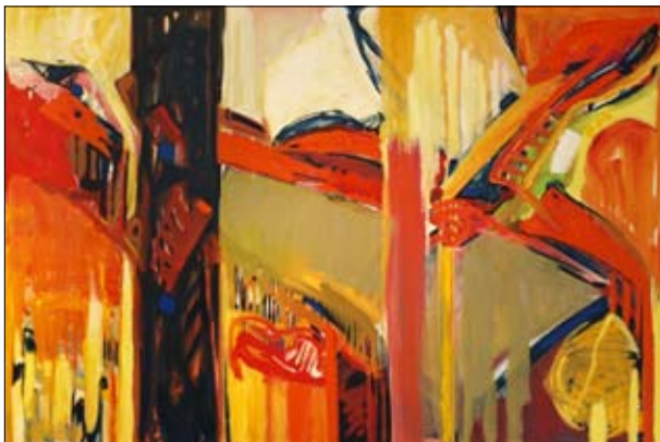
Oliemaleri str. 80 x 120 cm. 2011. "A Closer Look At The World Behind"