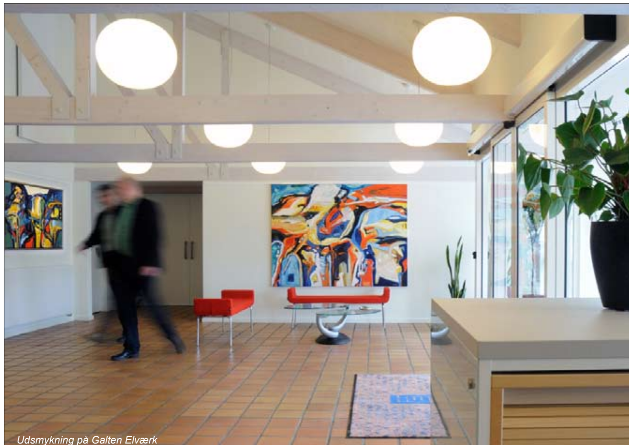
Udsmykning på Galten Elværk