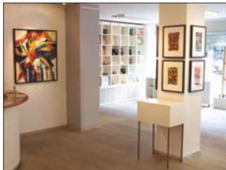
Et view fra udstillingen "JA" i Silkeborg Kunstnerhus september 2011