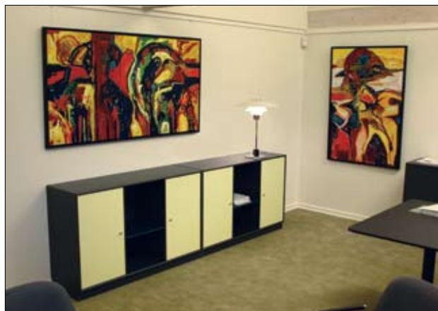
Et view fra udstillingen på Galten Elværk - november / december 2011